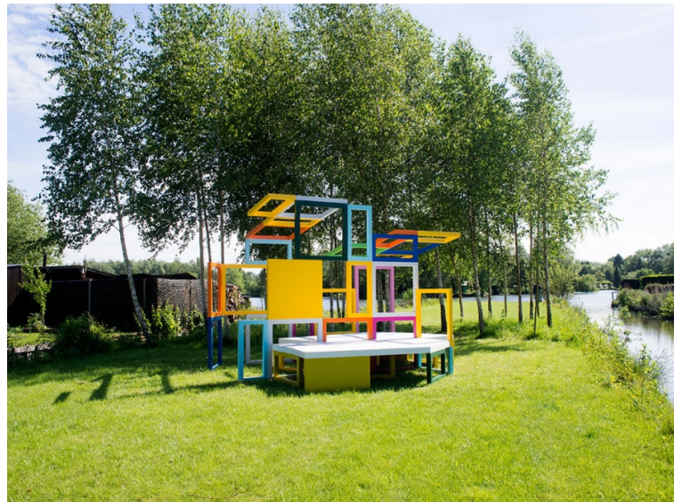
Un habitable , sculpture sur site, 340 x 360 x (h) 246 cm, coproduction : Maison de la Culture d'Amiens – centre européen de création et de production – dans le cadre du projet Art, villes & paysage - Hortillonnages Amiens