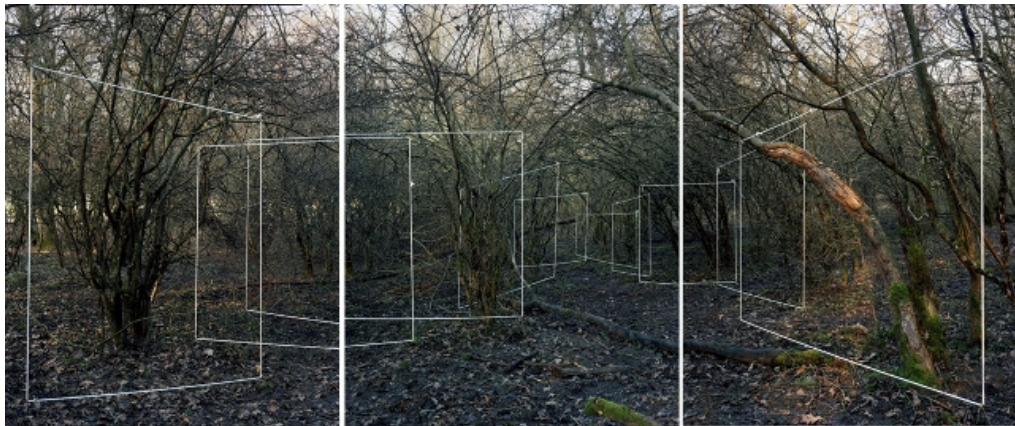
Je croyais voir un piège , 2012, techniques mixtes, 150x190 cm, Musée de la chasse et de la nature.