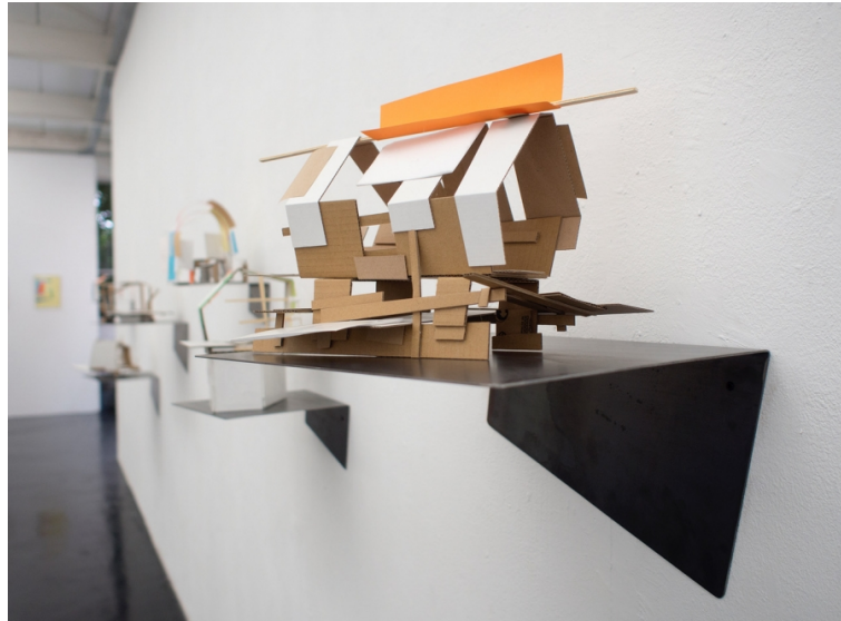
Des images et des maquettes abandonnées, Bilder und verlassene Modelle 1A Ausstellungshalle, Francfort 2017