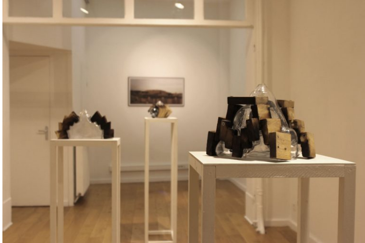
Vue de l'exposition à Surrounded , Art Connexion, Lille, 2016