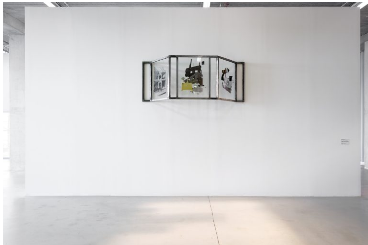
Test (All the houses you can live in) , 3 sérigraphies sur verre, châssis en acier, 214 x 84 x 3 cm Exposition Permanent déplacement au FRAC Grand Large – Haut de France, 2017, crédit photographique : Aurélien Mole.